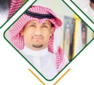
الشيخ تركي بن صالح البريكي عضوالمجلس