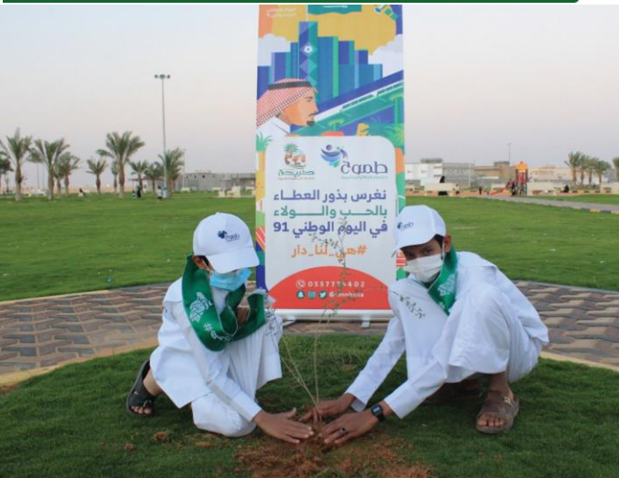
في اليوم الوطني شراكة مع جمعية طموح وغرس عدد من الشتلات